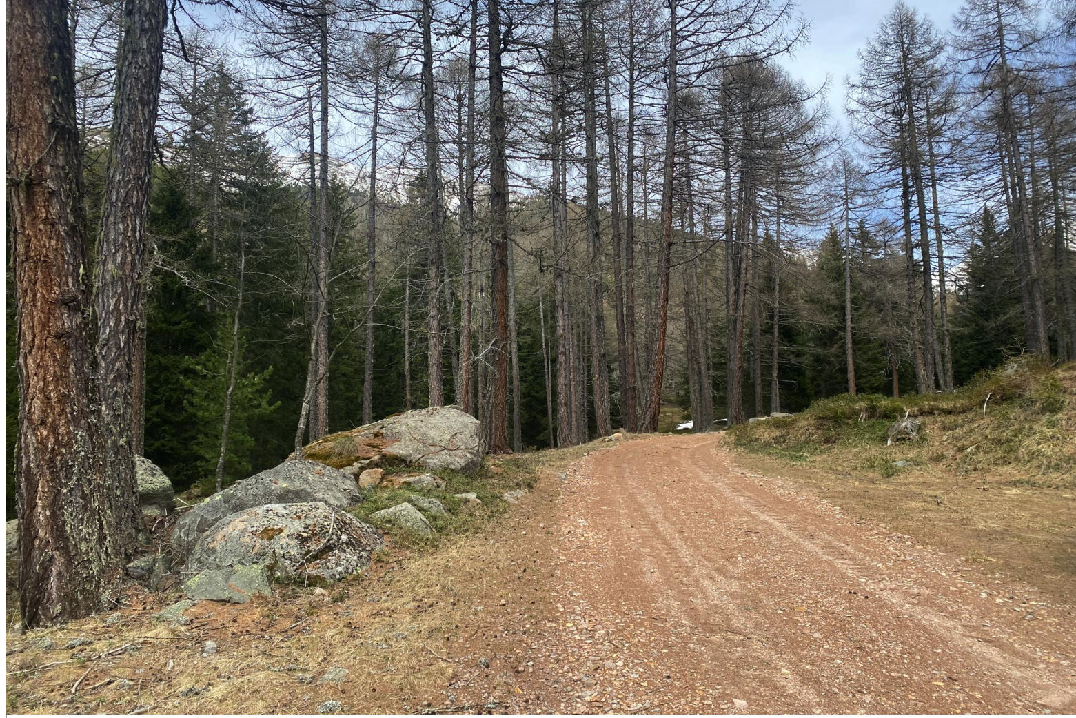
VISTA 4 - STRADA FORESTALE