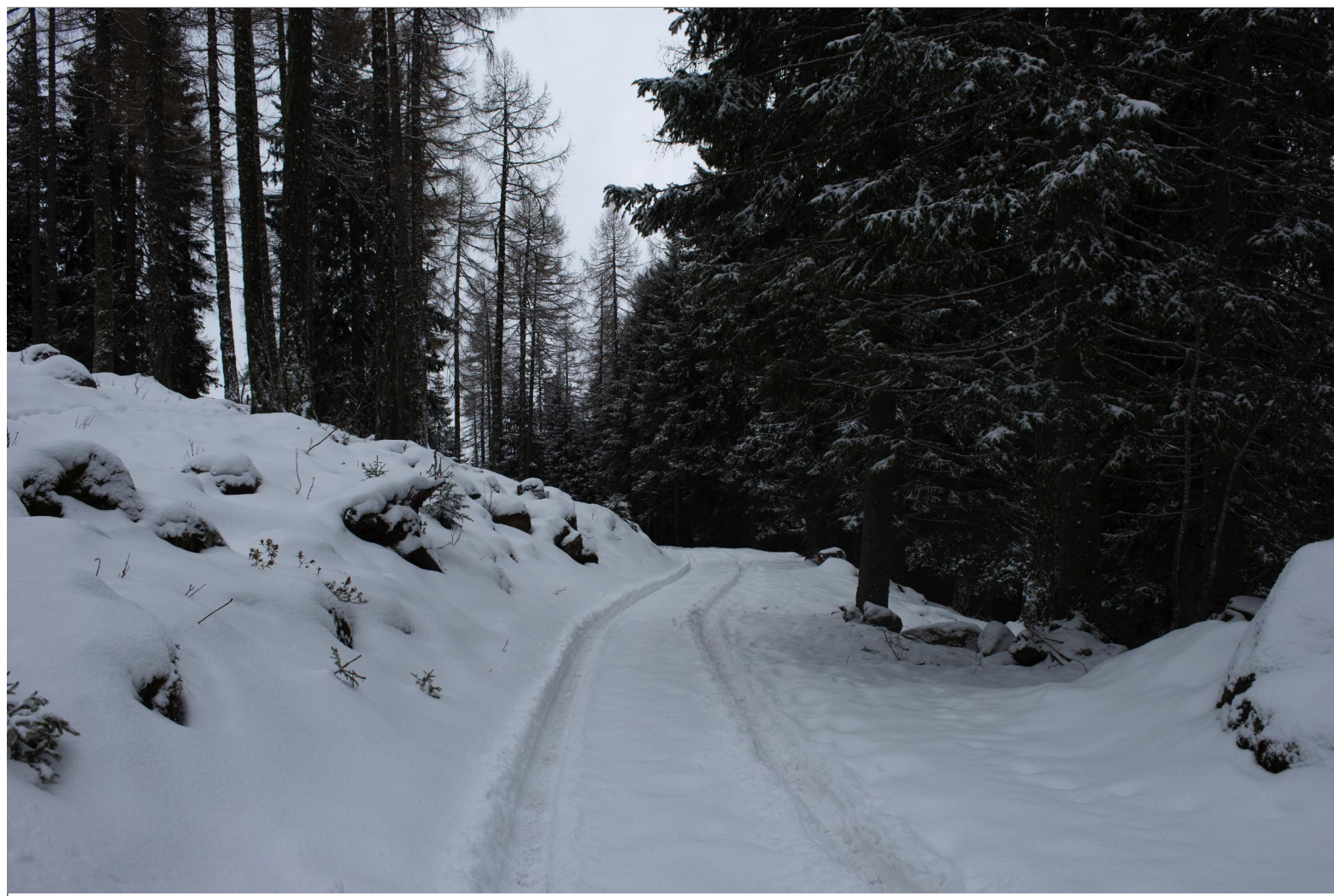
VISTA 1 - STRADA FORESTALE