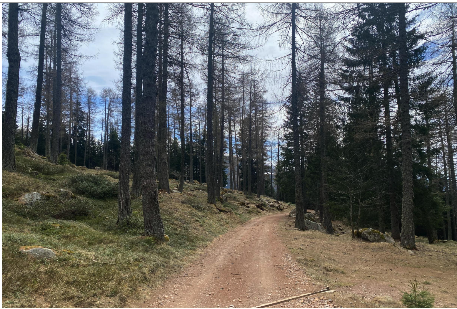
VISTA 1 - STRADA FORESTALE