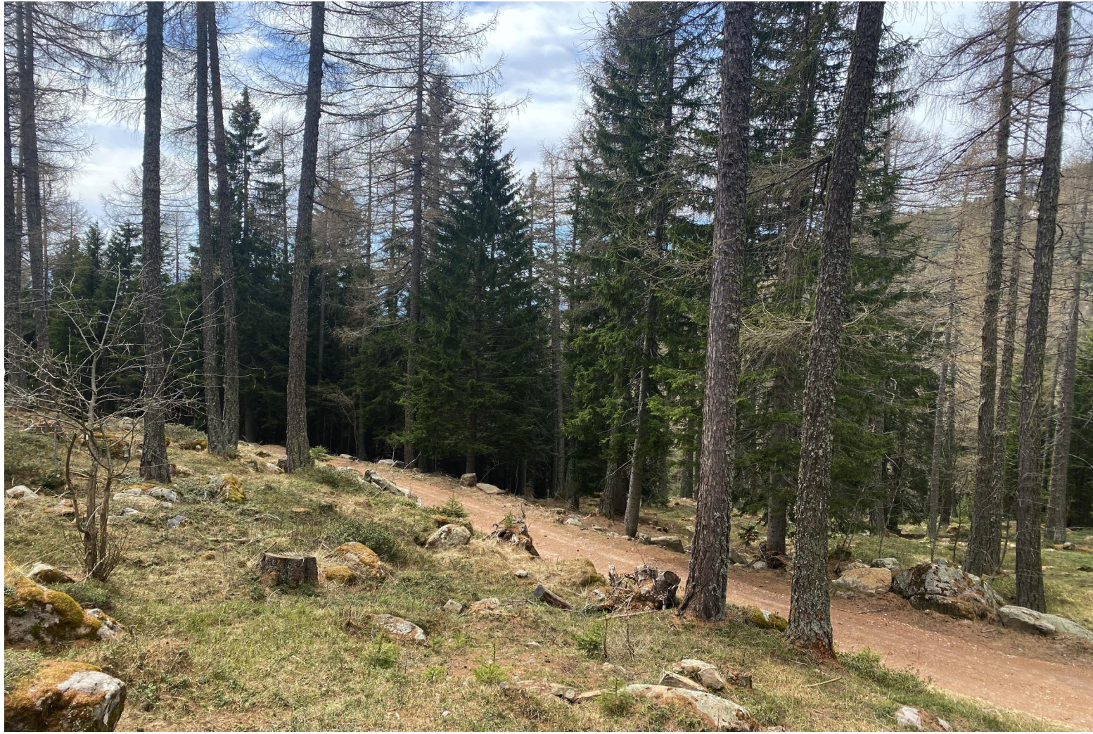
VISTA 5 - STRADA FORESTALE