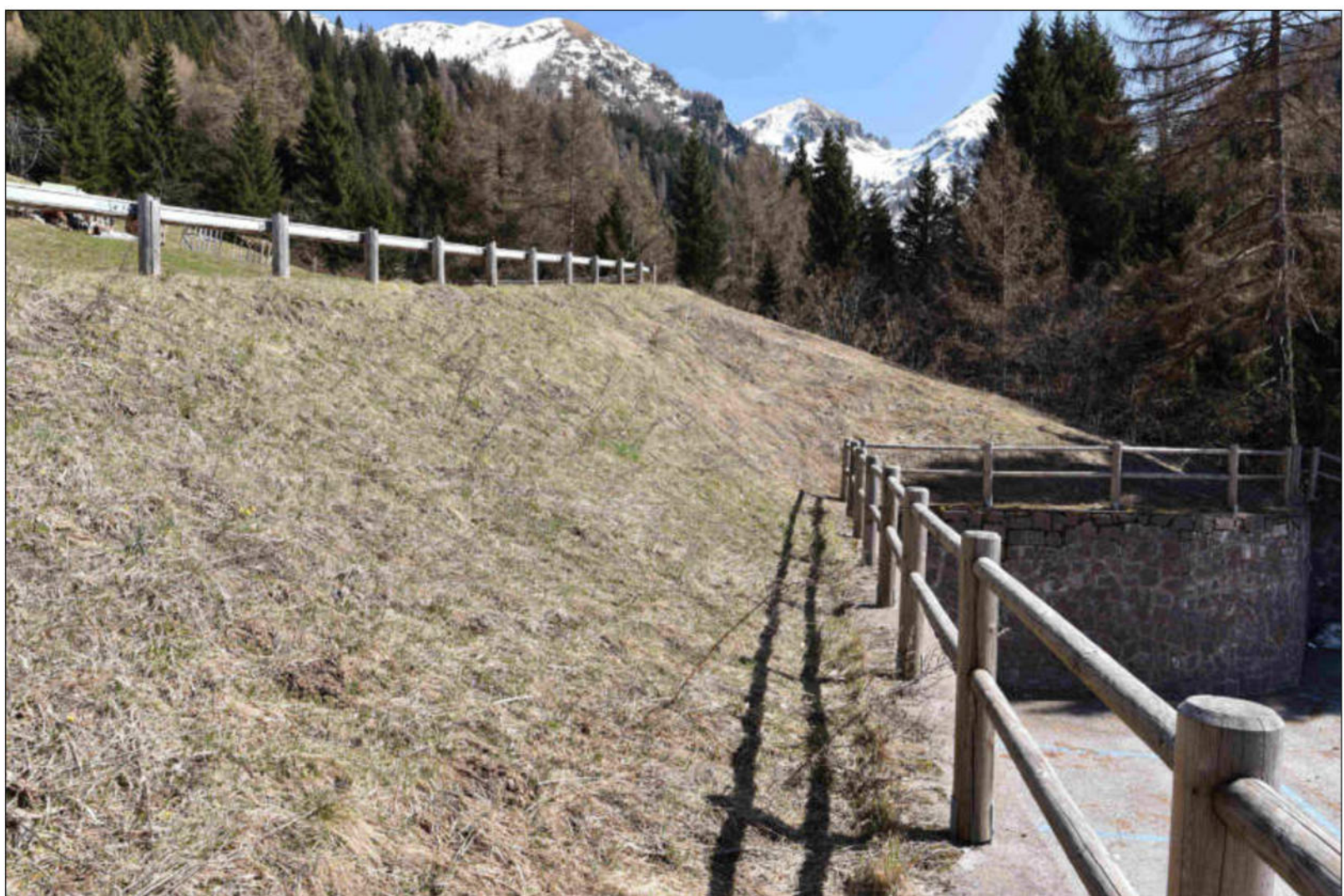
7 di data 06.04.2023