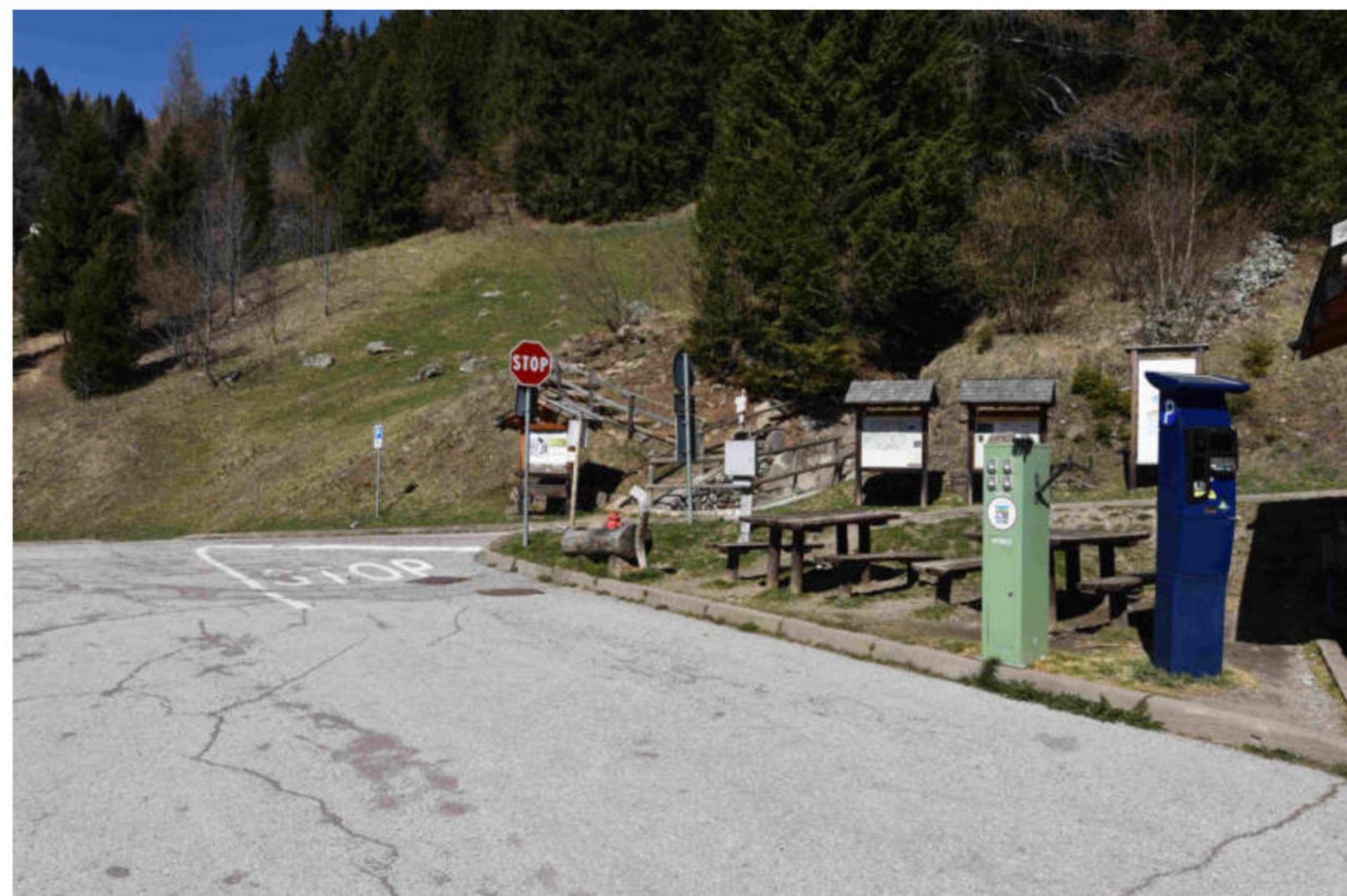
19 di data 06.04.2023