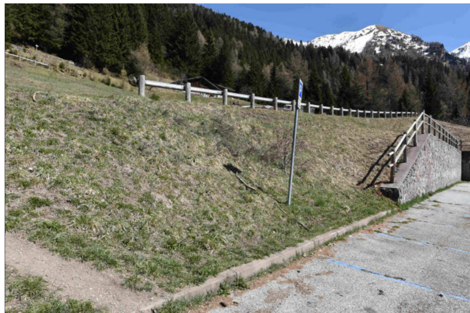
3 di data 06.04.2023