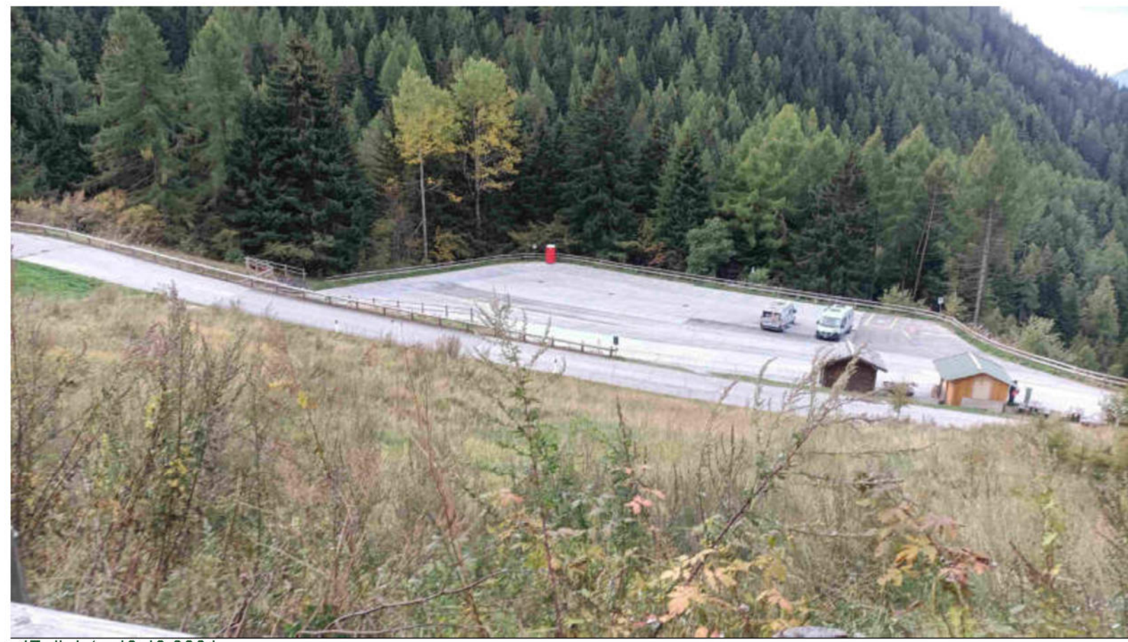
17 di data 13.10.2021