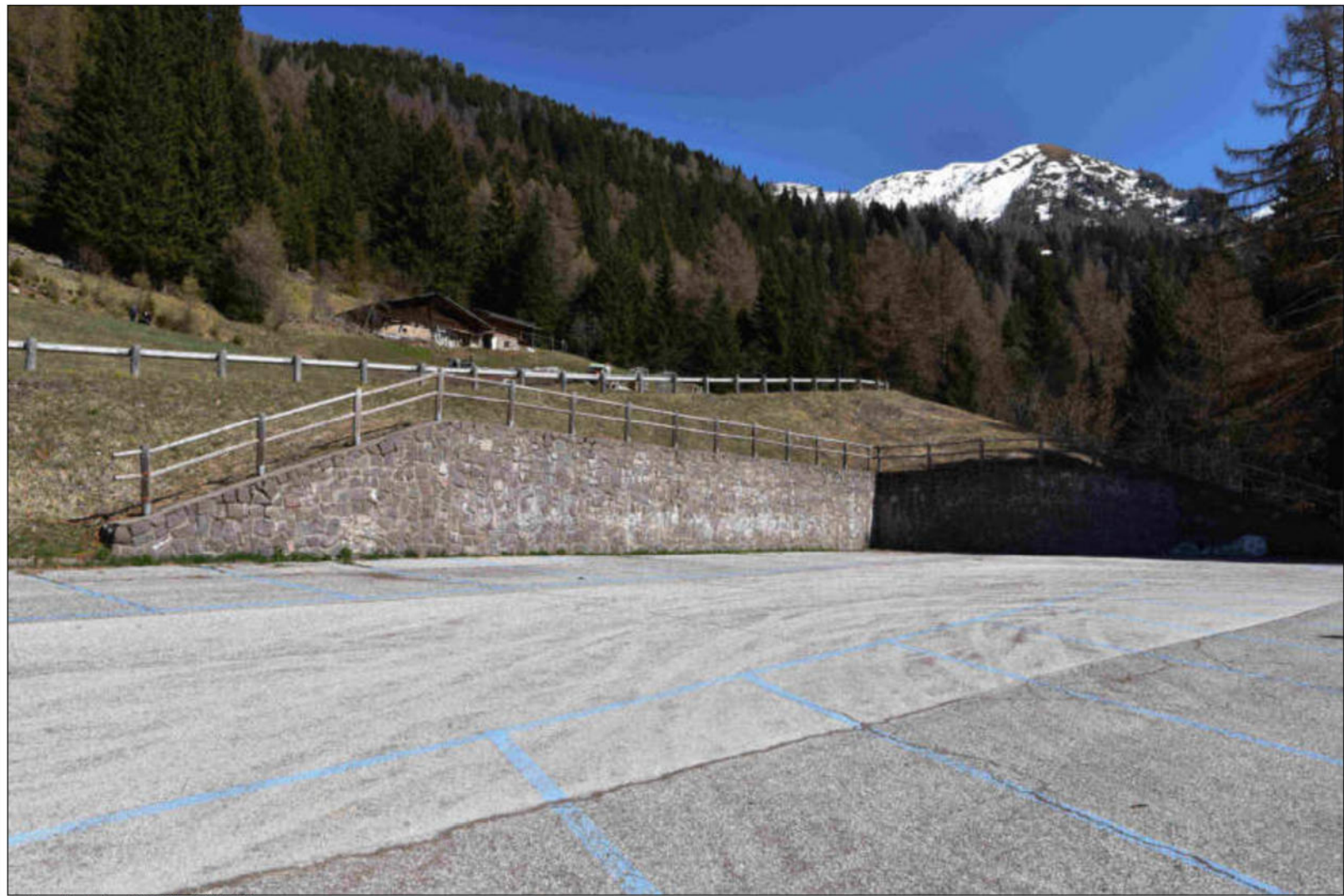
10 di data 06.04.2023