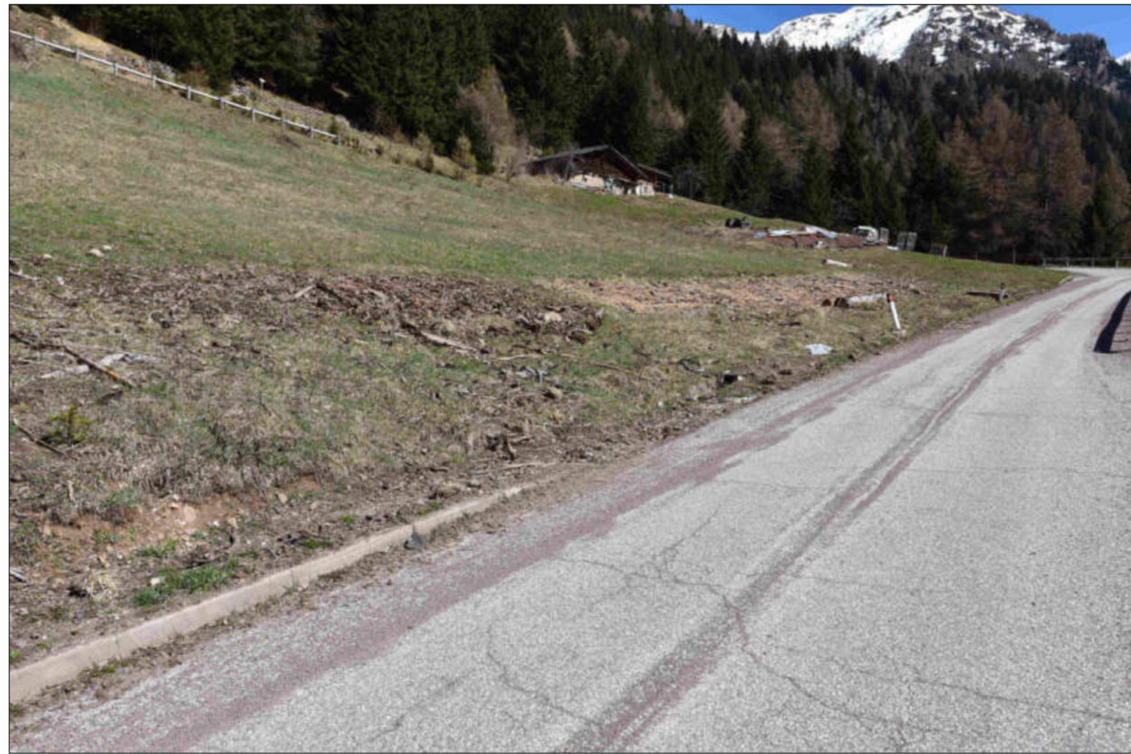
14 di data 06.04.2023