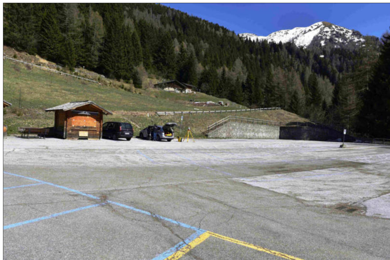
15 di data 06.04.2023