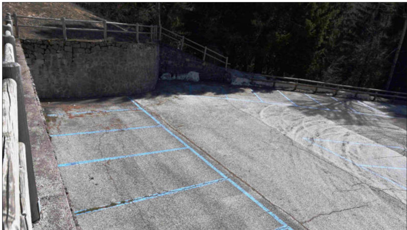
12 di data 06.04.2023