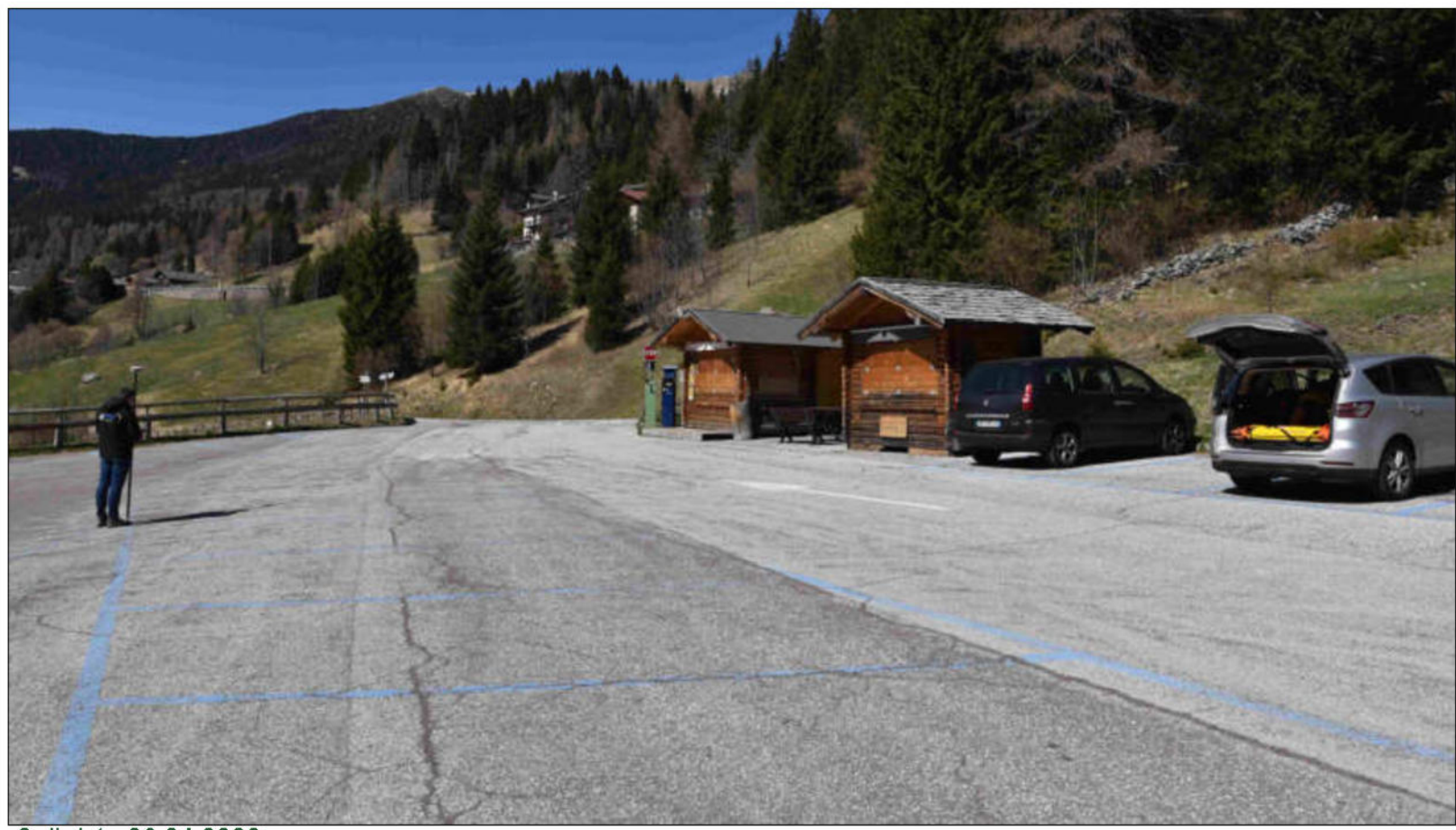
9 di data 06.04.2023