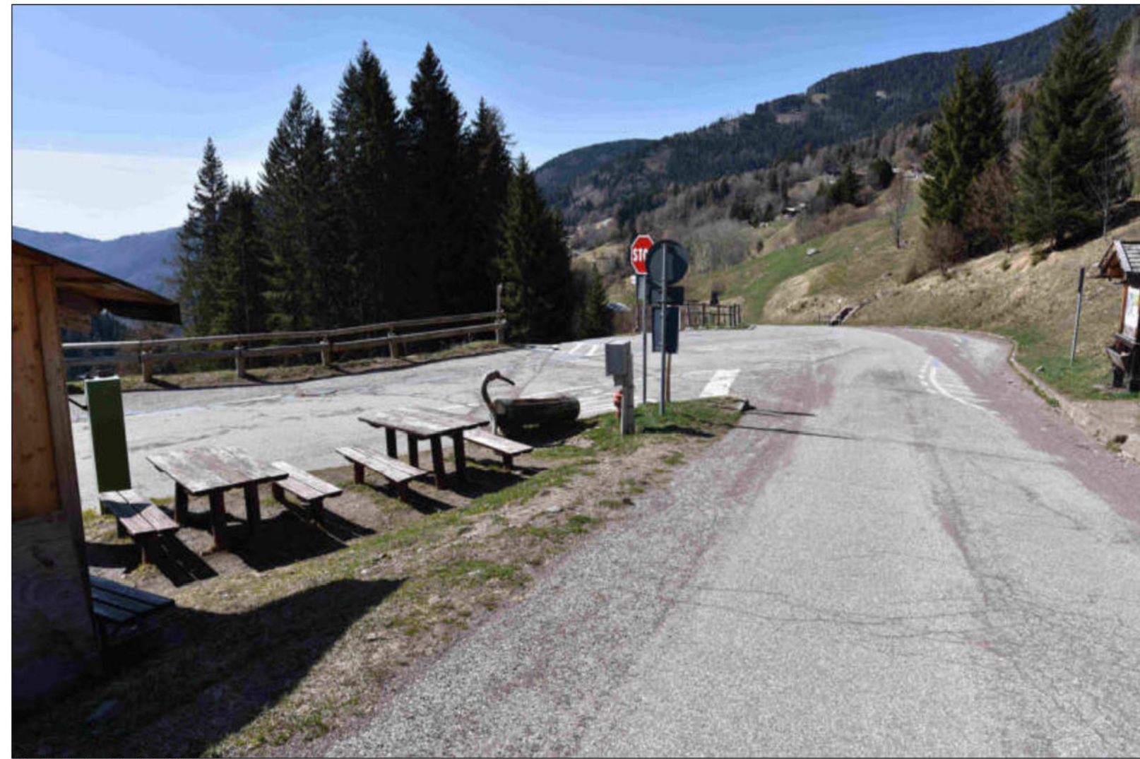
2 di data 06.04.2023