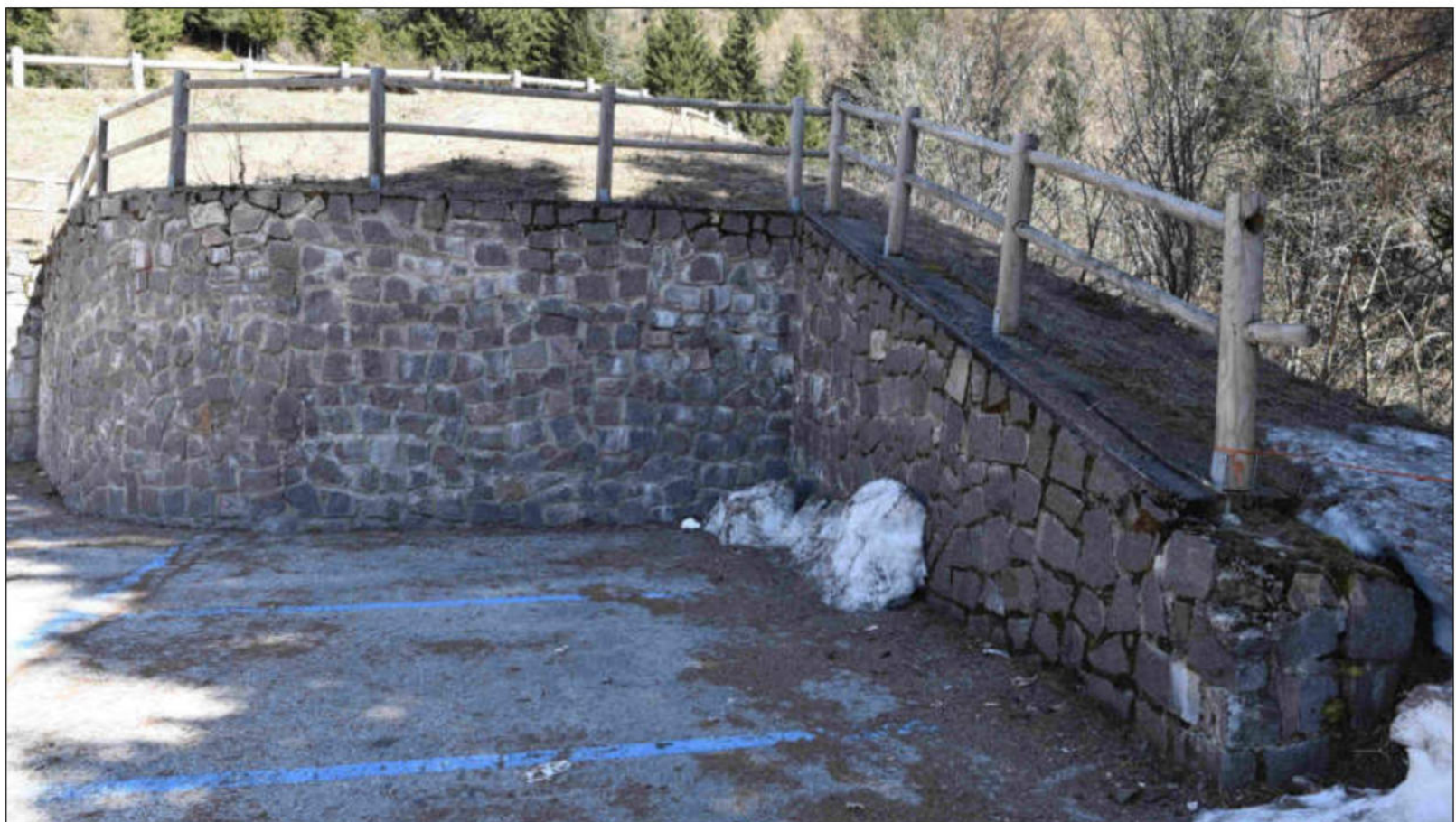
8 di data 06.04.2023