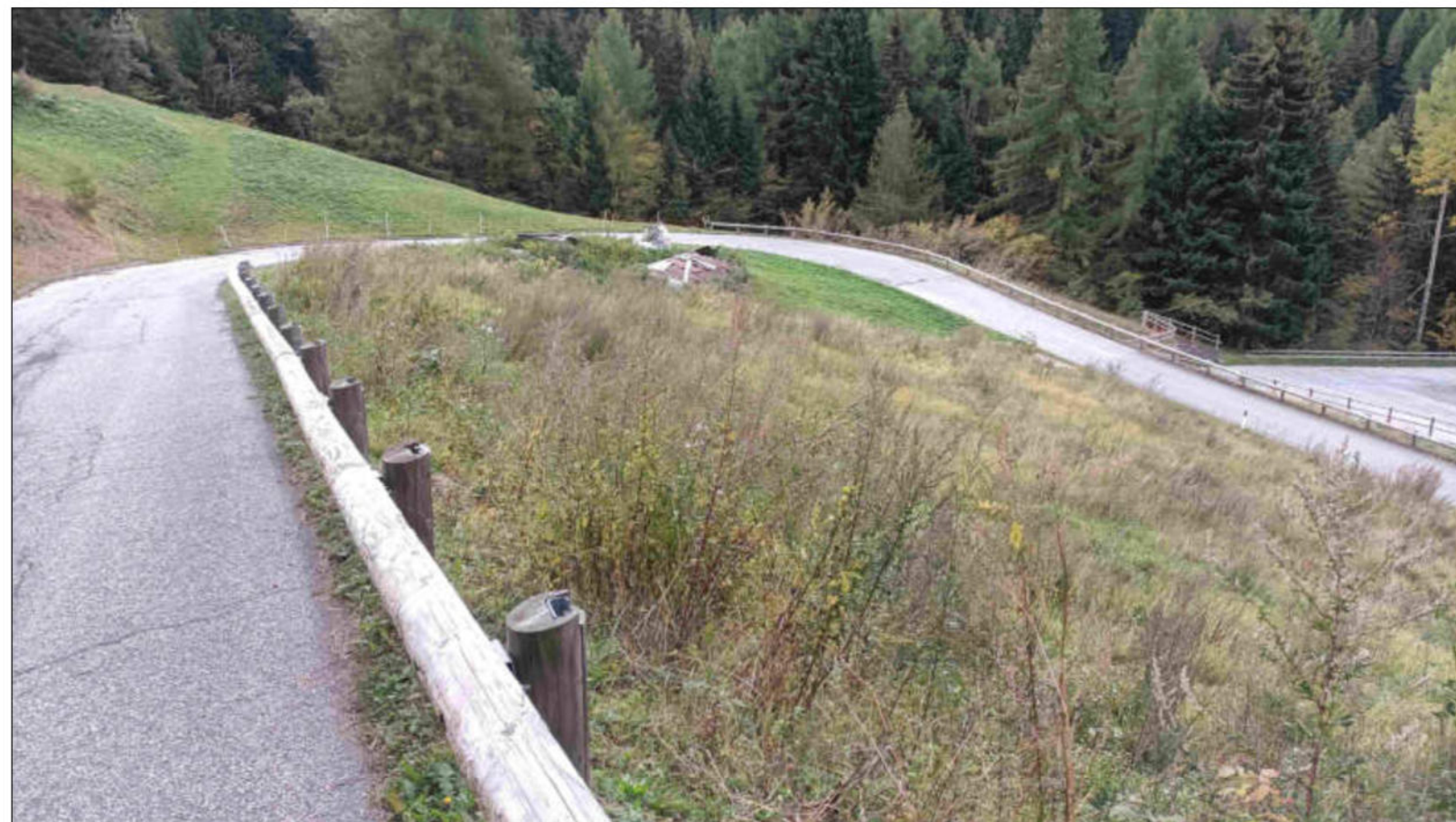
16 di data 13.10.2021