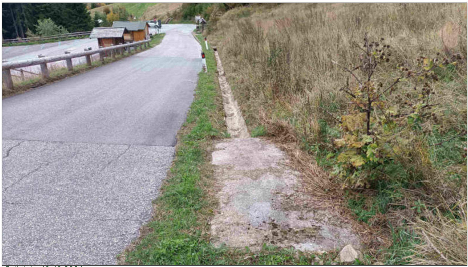
5 di data 13.10.2021