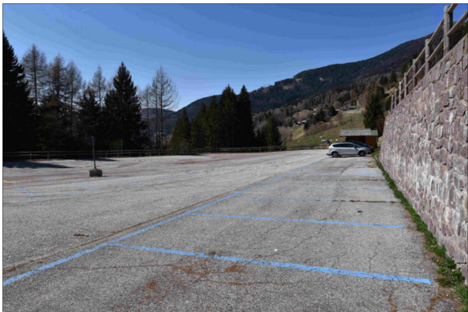
11 di data 06.04.2023