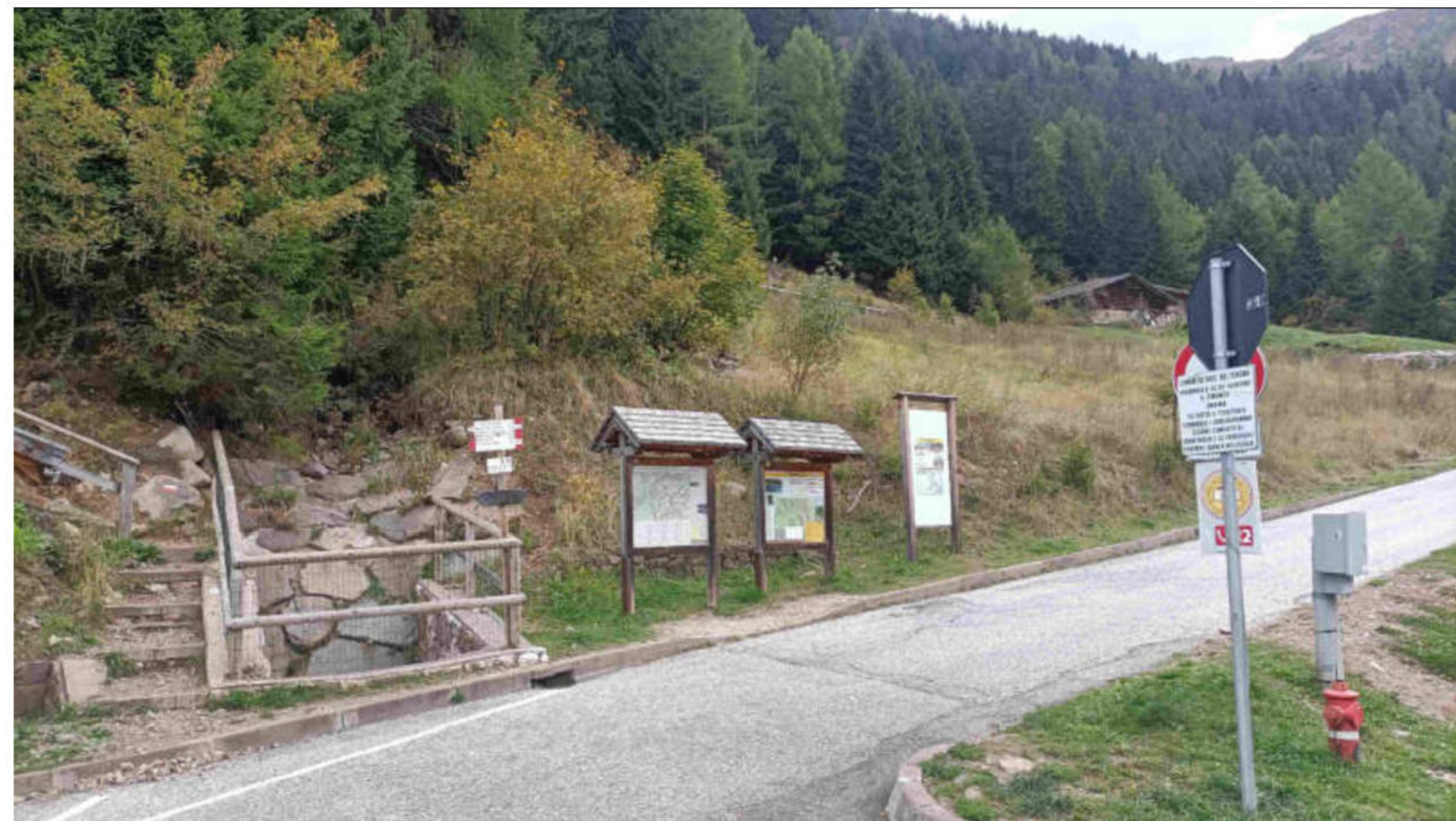
20 di data 13.10.2021