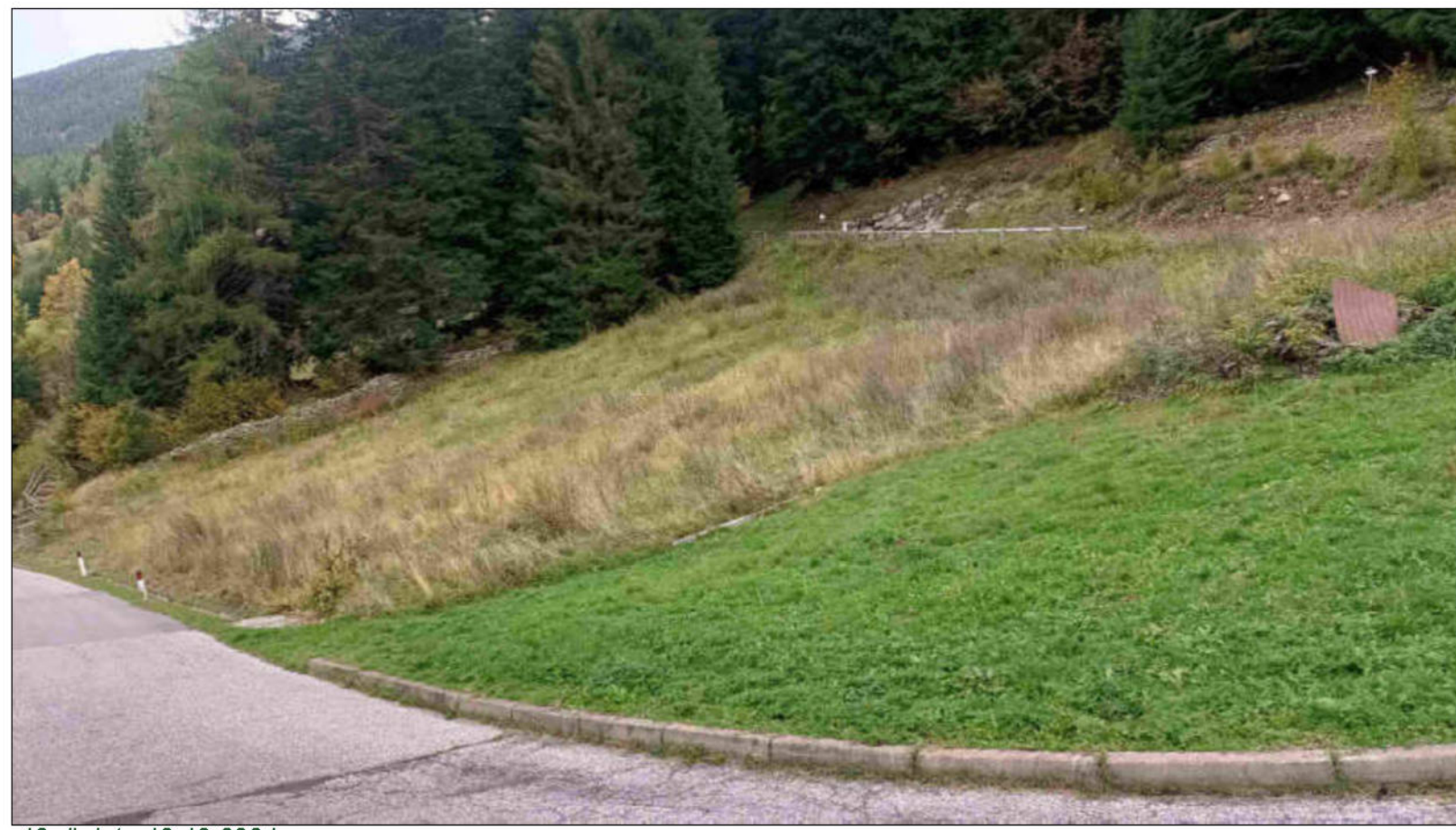
13 di data 13.10.2021