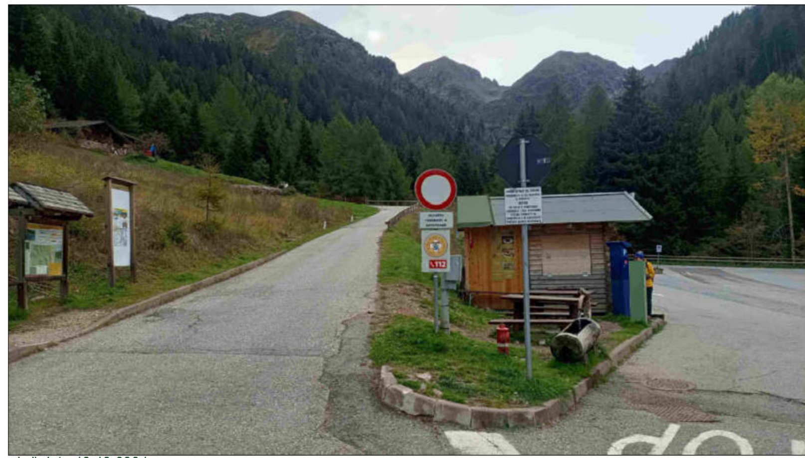
1 di data 13.10.2021