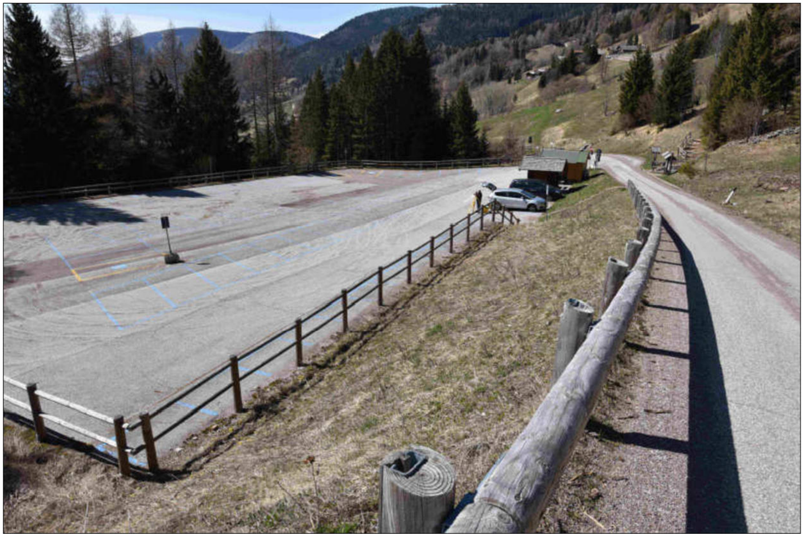
6 di data 06.04.2023