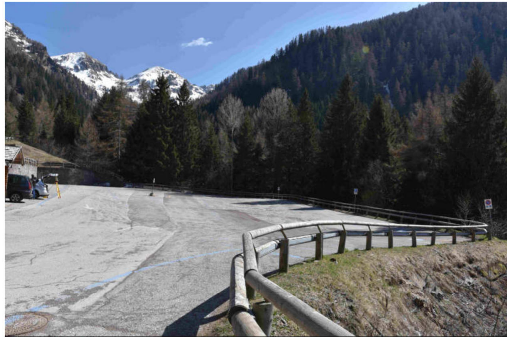
18 di data 06.04.2023